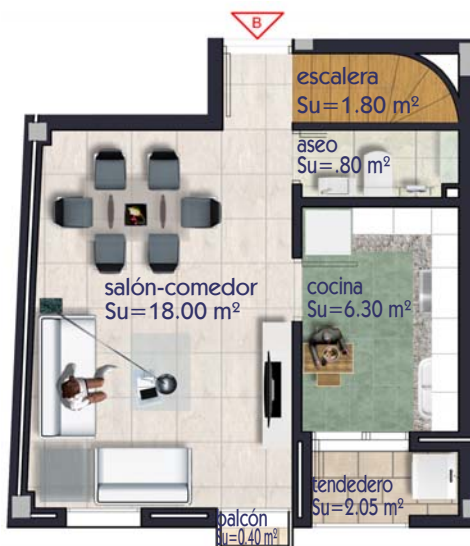
VIVIENDA TIPO -B- PLANTA DE ACCESO (1ª) escala 1 / 100