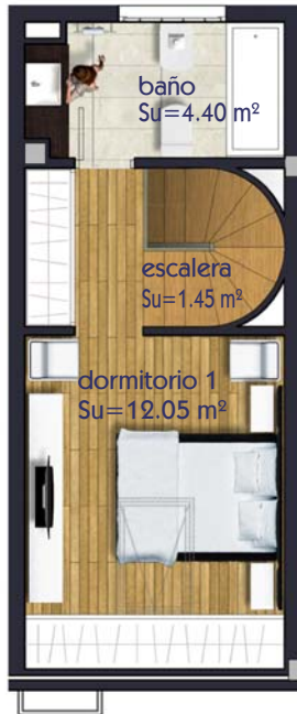
VIVIENDA TIPO -B- PLANTA BAJO CUBIERTA (B/C) escala 1 / 100