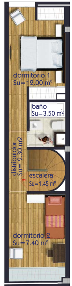
VIVIENDA TIPO -E- PLANTA BAJO CUBIERTA (B/C) escala 1 / 100