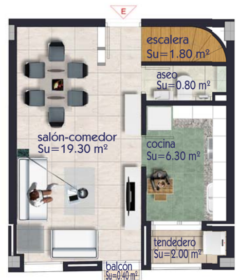
VIVIENDA TIPO -E- PLANTA DE ACCESO (1ª) escala 1 / 100