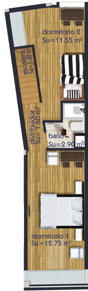
VIVIENDA TIPO -H- PLANTA BAJO CUBIERTA (B/C) escala 1 / 100