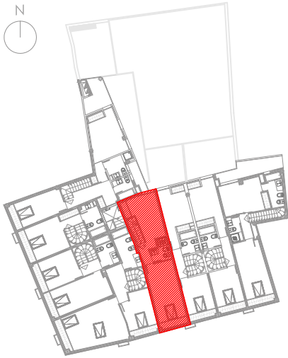
ESQUEMA SITUACIÓN DEL TIPO -H- P. BAJO CUBIERTA